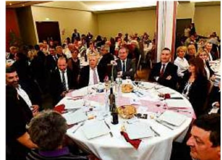
Lors de la Nuit de la Solidarité 2016.

Il reste encore des places. Réservations à la Maison des vins de Fronton : 05 61 82 46 33.